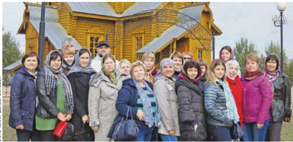
Группа комбинатовцев у храма священномученика Игнатия Богоносца

крыли. Полюбовавшись собором снаружи, мы вошли внутрь и поклонились обретенной святине – списку с чудотворной иконы «Троеручица Валуйская». Проезжая по улицам города, обратили внимание, что сохранилось много старинных зданий. Даже пресловутый ликёро-водочный завод и тот, оказывается, – старейшее предприятие страны (основан в 1887 году). Но самым древним строением считается храм святителя Николая Чудотворца, открытый в 1840 году. Ему удалось избежать разрушений благодаря тому, что его использо-