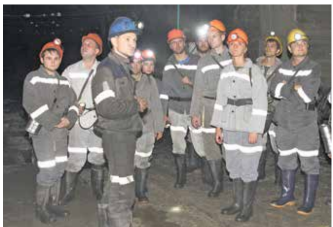
Молодые специалисты в шахте

Шахту посетили представители различных цехов и отделов. Каждый из них отметил, что все ветви производства тесно связаны друг с другом.