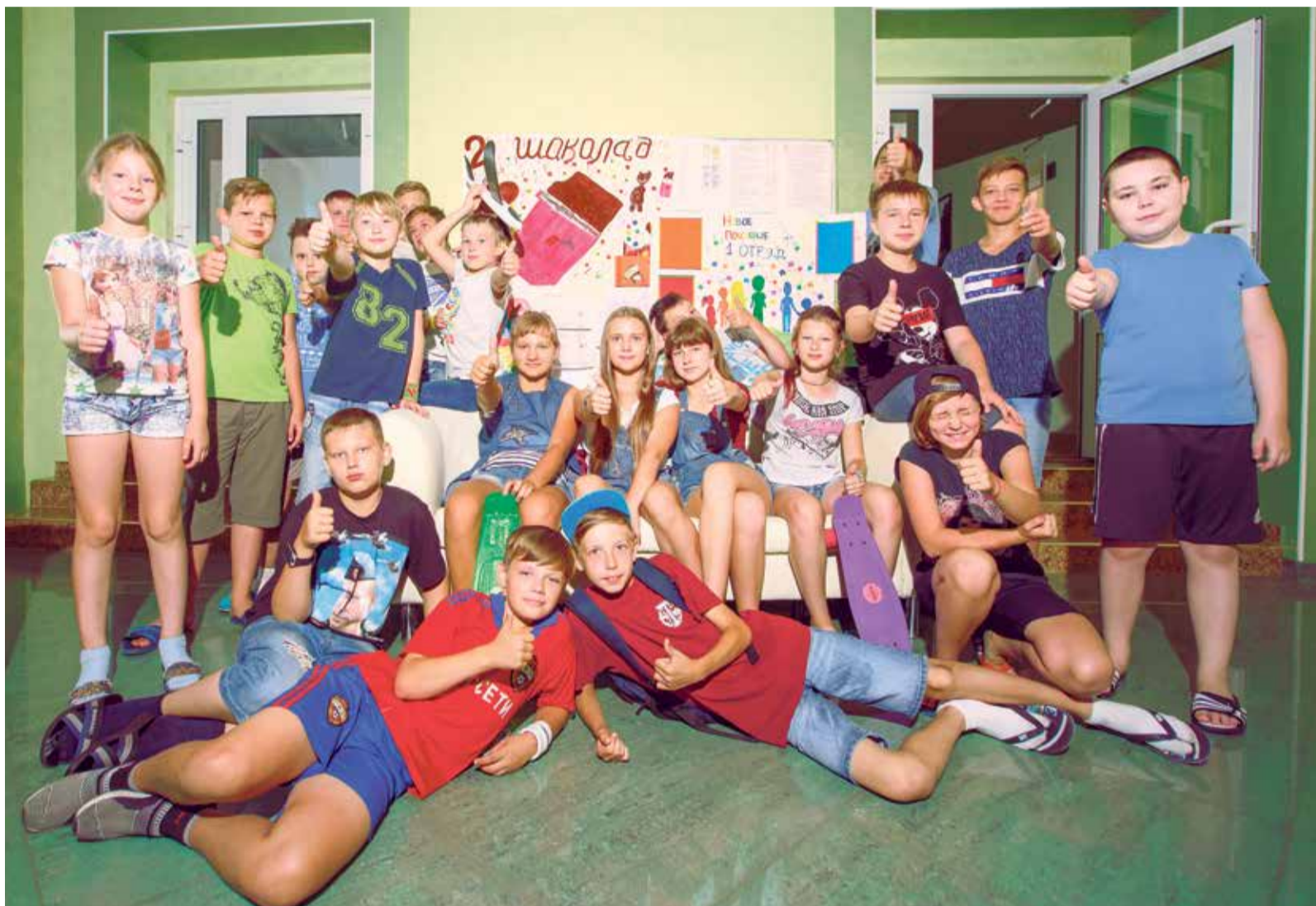
Ребята из старшего отряда