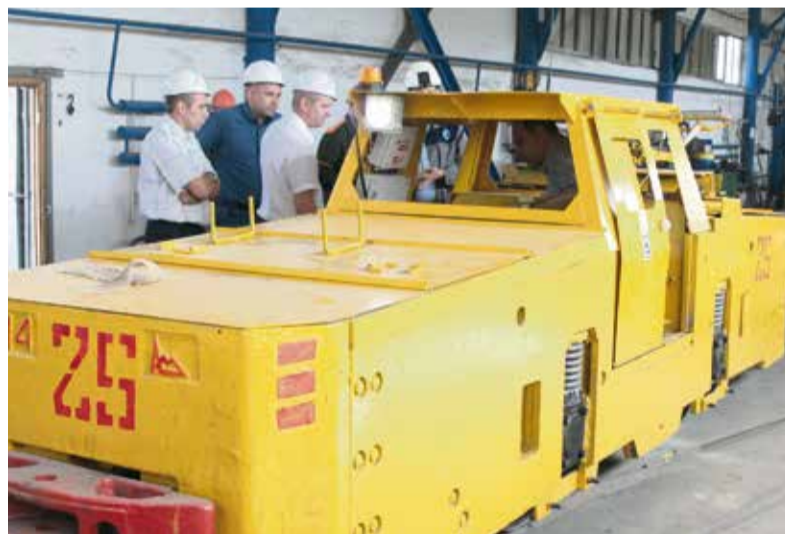
Комиссия осматривает электровоз

Преображение техники занимает около двух месяцев.