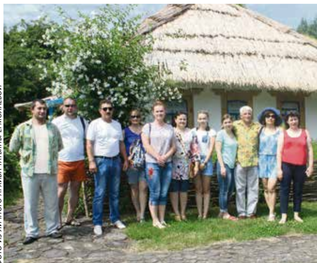
Некогда обычный домик – теперь экспонат