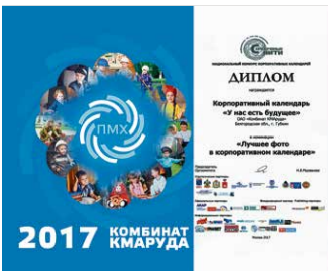
Обложка календаря и диплом

Достижение тем более значимо, что Комбинат КМАруда участвовал в самой многочисленной категории – среди предприятий с численностью от 1000 до 5000 трудящихся. Стоит отметить и то, что комбинатовцы традиционно занимают лидирующие позиции на протяжении всех 14 лет – именно столько проводится данный конкурс. В этом году в нём участвовали 56 коллективов.