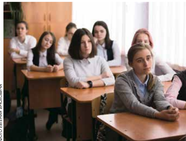
Профориентационная беседа в школе № 1