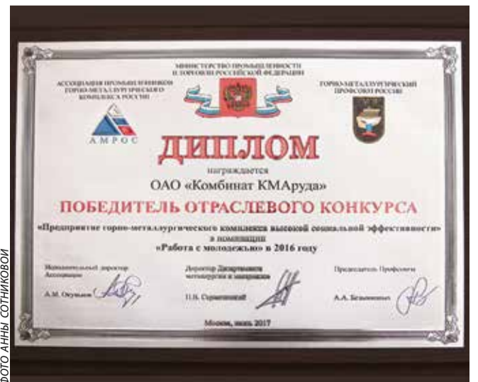
Диплом стал подарком ко Дню металлурга