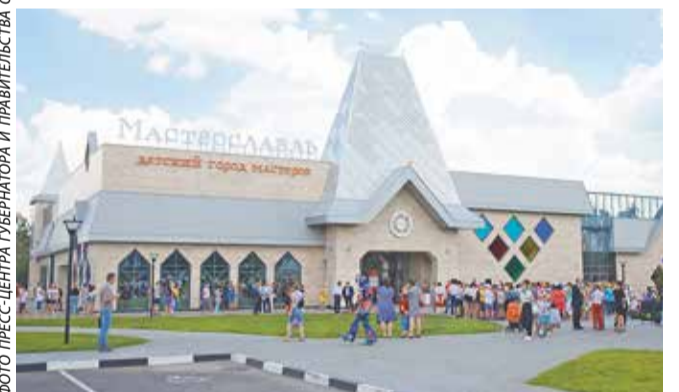
Здание построено в стиле русского зодчества

ФОТО ПРЕСС-ЦЕНТРА ГУБЕРНАТОРА И ПРАВИТЕЛЬСТВА ОБЛАСТИ