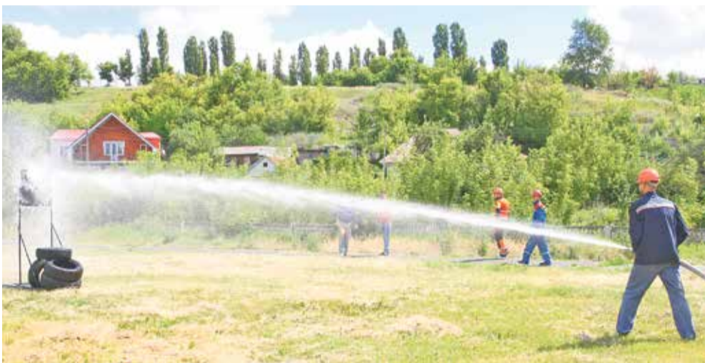
Поражение мишени во время боевого развёртывания