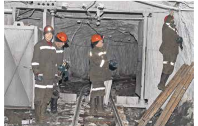
Бригада участка энергоснабжения