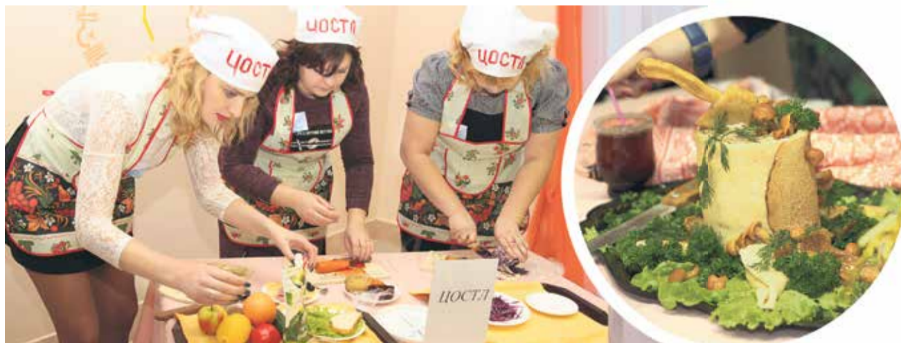
Во время этапа «Гости на пороге»