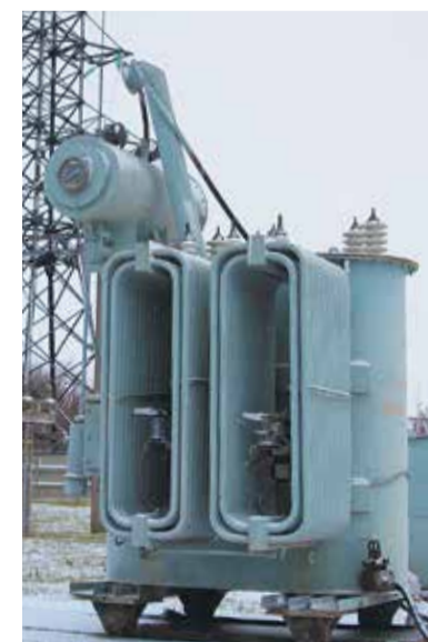
Резервный трансформатор ТД 10000 кВа