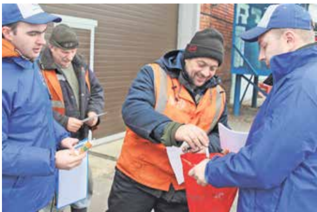
Молодые специалисты в железнодорожном цехе

Международный день отказа от курения отмечается ежегодно в третий четверг ноября. В этот раз он пришёлся на 16 число.