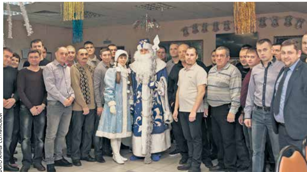
Виновников торжества поздравили Дед Мороз и Снегурочка