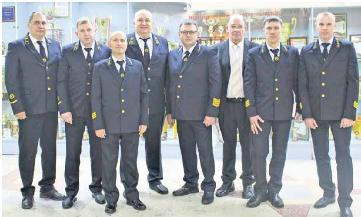
Угольщики ПМХ обсудили вопросы безопасности

В конце февраля на базе Кемеровского угольного разреза состоялся круглый стол, главной темой которого стало состояние промышленной безопасности на угольных предприятиях, ведущих горные работы на территории Кузбасса.