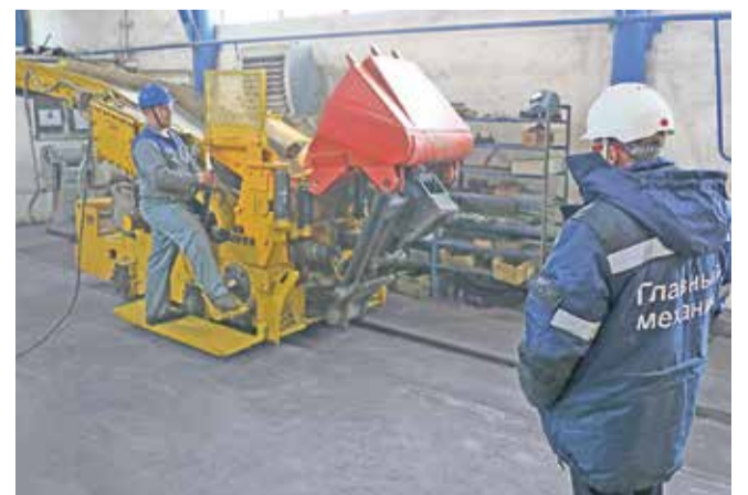
Главный механик комбината осматривает 1 ППН-5

С момента открытия участка капремонта горно-шахтного оборудования в 2017 году это уже пятая капитально отремонтированная машина 1 ППН-5.